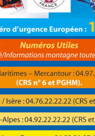
Texte Bulletin CAF Nice N°212 PAGE 4